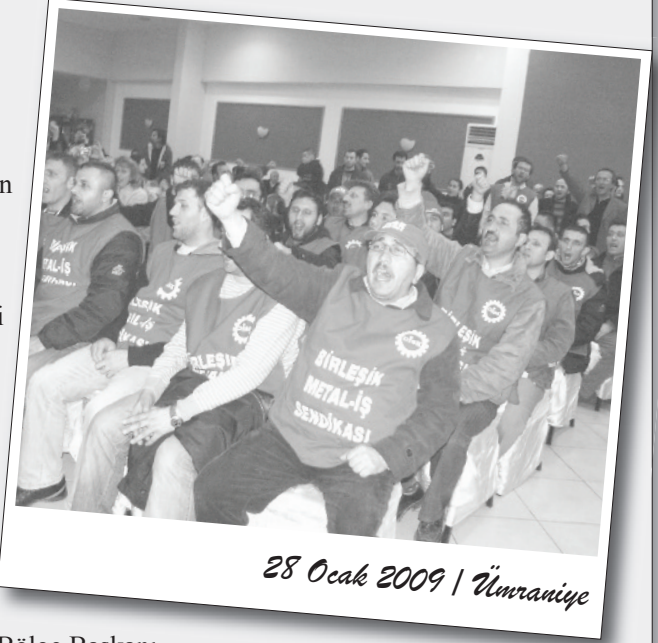
28 Ocak 2009 / Ümraniye

Geceye bini aşkın işçi ve emekçi katıldı.